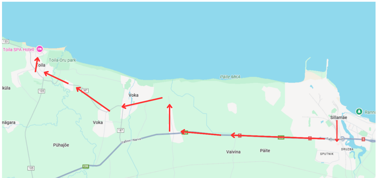
Sillamäe Rattapäevak 16.08.2025, skeem 2. Marsruut Sillamäe-Valaste-Sillamäe